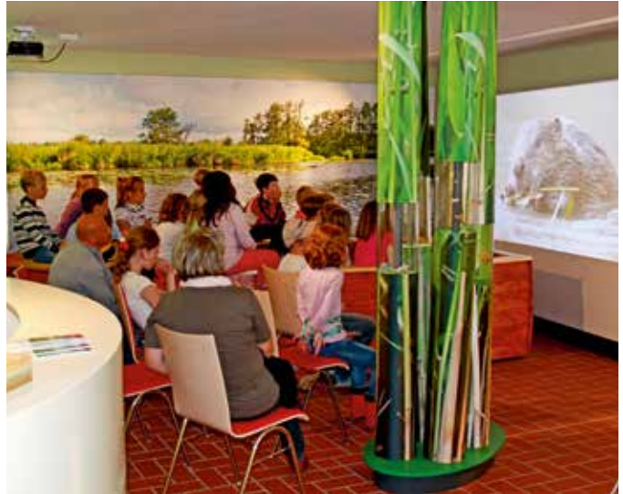
Interaktive Dauerausstellung Naturparkstation Stolpe

Der Naturpark misst der Öffentlichkeitsarbeit und Umweltbildung bereits einen hohen Stellenwert zu und bietet ein breites Spektrum an Maßnahmen der Öffentlichkeitsarbeit und Umweltbildung an, die auch für den Tourismus bedeutsam sind. Dennoch kann das Angebot weiter optimiert werden. Ziel sollte es sein, nicht nur