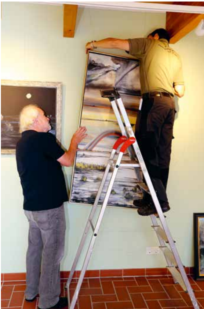
Wechsausstellung in Naturparkstation Stolpe

Wir wollen die kulturelle und soziale Infrastruktur stärken, um die Attraktivität der Naturparkregion für Einheimische und Besucher Gleichmaßen zu steigern.