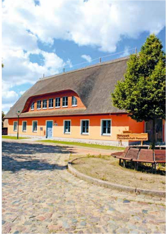
Naturparkstation in Stolpe

Gemäß § 7 Abs. 1 der Verordnung sowie gemäß § 3 Nr. 4 des Naturschutzausführungsgesetzes M-V (NatSchAG M-V) ist durch die Naturparkverwaltung bzw. das LUNG M-V in Zusammenarbeit mit den flächenmäßig am Naturpark beteiligten Gemeinden sowie den Regionalen Planungsverbänden Vorpommern und Mecklenburgische Seenplatte im Einvernehmen mit