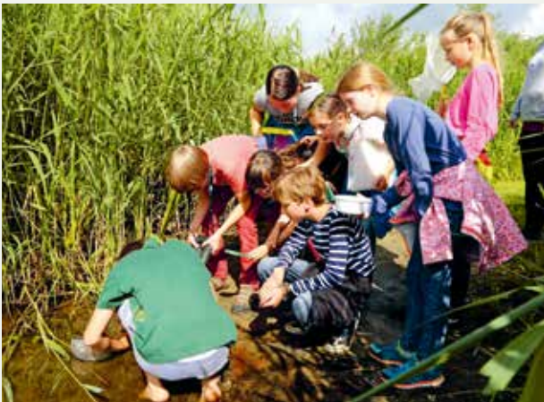
Wasserwerkstadt Montessori HGW

Im Naturpark besteht ein Informationsnetz, das neben dem Besucherzentrum in Stolpe an der Peene, zahlreiche dezentrale Informationspunkte integriert und damit auch die Umweltbildung „auf eigene Faust“ ermöglicht.