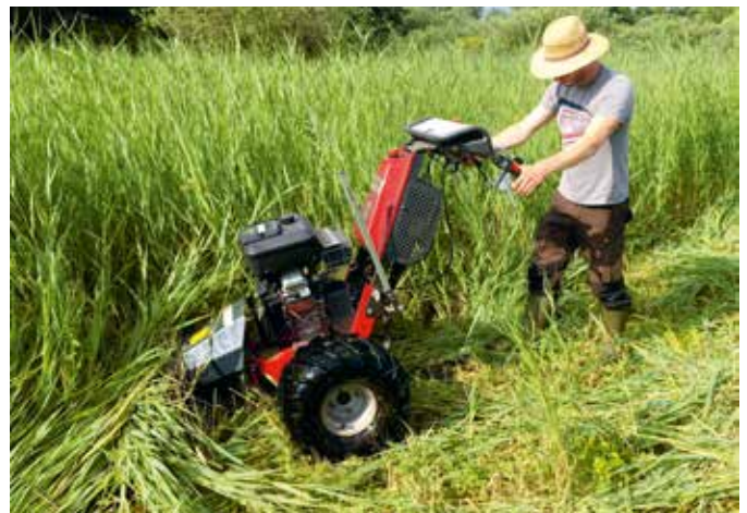
Landschaftspflege mit Balkenmäher

im Vordergrund. Es besteht die Pflicht zum Erhalt der Vorkommen und zur Verbesserung der Habitateigenschaften für das Sumpf-Glanzkraut und die Vorgabe der Biodiversitätsstrategie des Landes M-V, die Populationen der stark gefährdeten Arten zu stabilisieren.