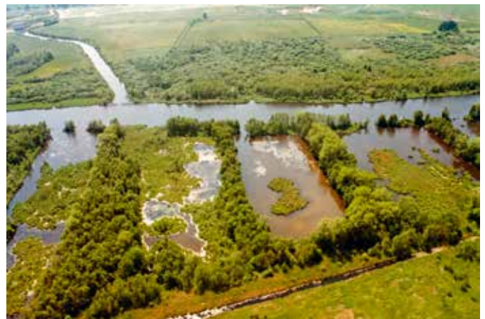
Peene mit Torfstichen Luftbild

Die Hauptaufgabe des Naturschutzgroßprojektes war die Schaffung der ökologischen und sozioökonomischen Voraussetzungen für eine flächendeckende Ausweisung der rund 20.000 ha großen Kernzone als Naturschutzgebiet.