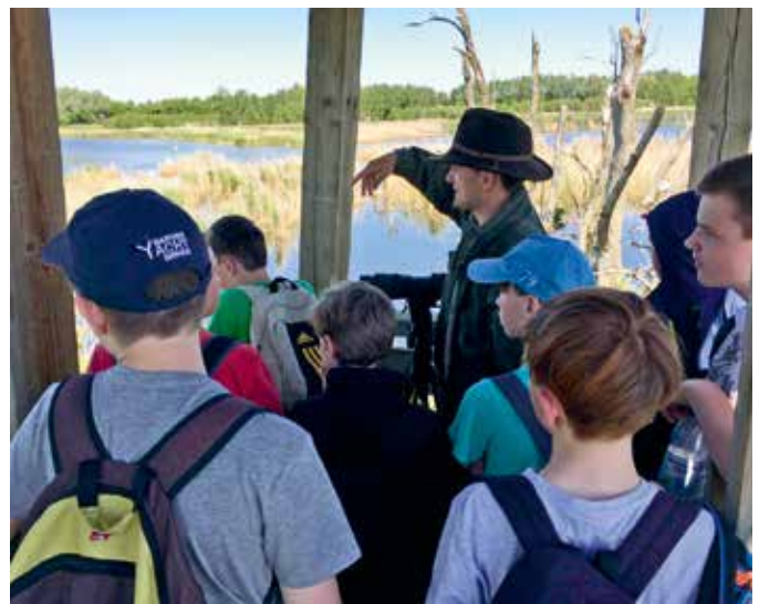
Ranger mit Schülern auf Aussichtsturm

Um im Sinne der Natur- und Landschaftsverträglichkeit auf das Besucherverhalten einzuwirken, soll die Lenkungsfunction durch geeignete Routenführung von Rad-, Wander- und Reitwegen sowie einer integrierten Gestaltung von Informations- und Leiteinrichtungen erfolgen. Diese sollen sich aus wege- und routen-