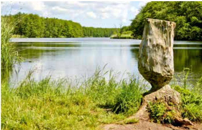
Peene mit „Biberbaum“

Das Monitoring und die Biberzählung des Naturparks sollen fortgesetzt werden. Unter Einbeziehung von Experten (Bibermanagement M-V) werden Lösungsvorschläge bei Konflikten zwischen anthropogener Nutzung und Aktivitäten entwickelt. Da der Biber als Schlüsselart die natürliche Entwicklung der Gewässer-