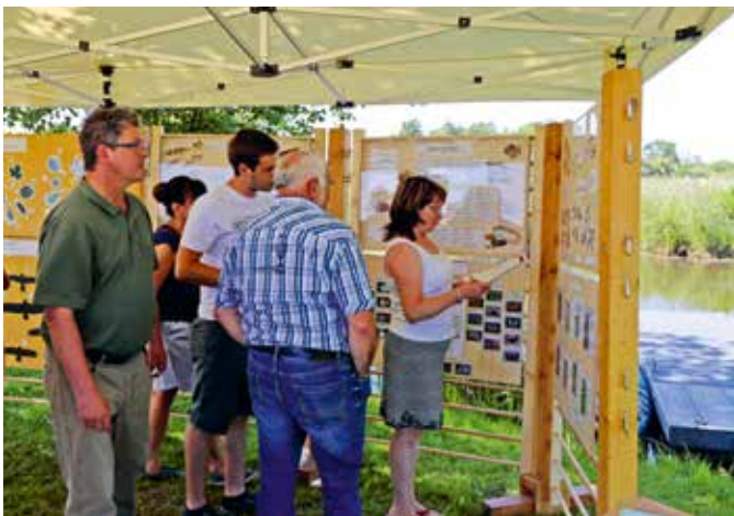
Ausstellungsmodule Kanalfest Liepen

Auch hinsichtlich der weiteren Entwicklung von Tourismus und landschaftsgebundener Erholungsformen, die ökologisch verträglich erfolgen sollen, kann die Naturparkverwaltung als eine zentrale Verwaltungsgrenzen übergreifende Koordinierungsstelle tätig werden und sollte die relevanten Akteure zu regelmäßigen Naturpark-Foren einladen.